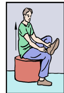
Restez assis pour mettre vos chaussures