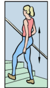
Gardez le dos droit