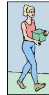
Portez une charge inférieure à 5 kg calée contre vous