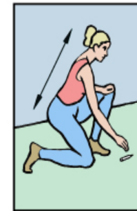
Pliez les jambes pour ramasser un objet au sol