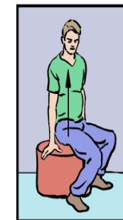
Levez-vous, dos droit,